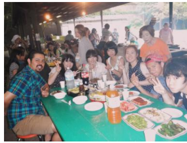
みんな一緒に盛り上がりました

一行は8月2日、まず市役所で市長、市議会議長へ表敬訪問、「第一印象は？」と聞かれ、「すべてがスモールだけどニート」という答えが返ってきました。昇高校では高校生同士の交流で盛り上がり、互いに歌や踊りを披露しました。少年自然の家ではIIA学生会の若者たちとバーベキュー、スイカ割り、花火を楽しみました。翌3日は、動植物園、コルトン・プラザ、現代産業科学館、メディア・パークを訪問、夕方にはアイ・リンク・タワーで「いちかわ市民花火大会」を満喫しました。4日の自由行動日をはさみ、5日～7日は、都内、ディズニー・シー、市川警察、