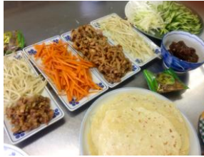
準備万端！ 春餅の材料

メインメニューは中国人メンバーの希望でおもに中国北方の伝統的な食べ物、春餅(チュンビン、chunbing)にしました。薄餅(バオピン、bobing)の一種で本来は立春の日のお祝い料理用ですが、普段にも食されています。