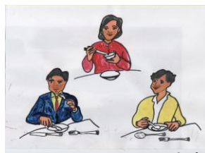
自作のイラスト教材 たべます