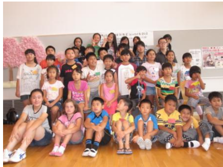
今年も楽しかったなーと41人の仲間たち