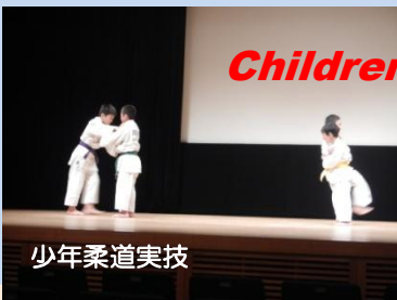
サバイバル日本語教室のこども達

外国の踊り、よさこいソーラン、日本舞踊などのエンターテインメント、サバイバル日本語学校で学んだこども達の歌、日本語スピーチコンテストでは、ちょっぴり辛口コメントが飛び出したり、多彩なプログラムが繰り広げられました。