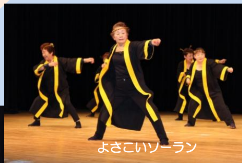
よさこいソーラン