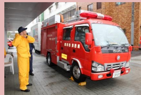
消防車も来てくれました