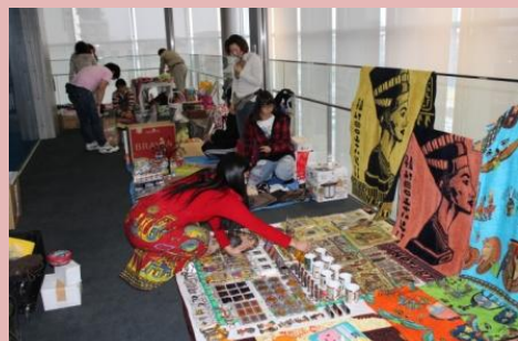
フリーマーケットで世界の品が