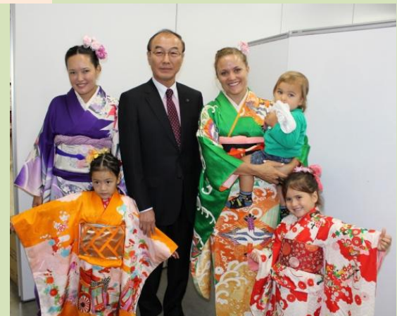
晴れ着姿で大久保市長とショット

午後から会場は「カフェテリア・こんにちは」に早変わり、カレーやナシゴレンなど外国の食べ物を楽しんでいただきました。