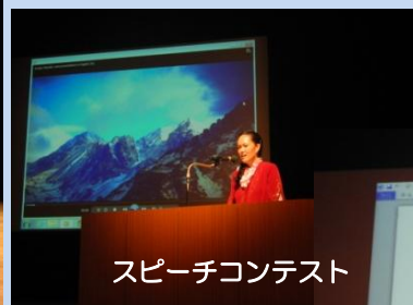
スピーチコンテスト